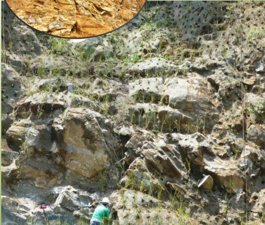
Suelos de fragmentos de roca