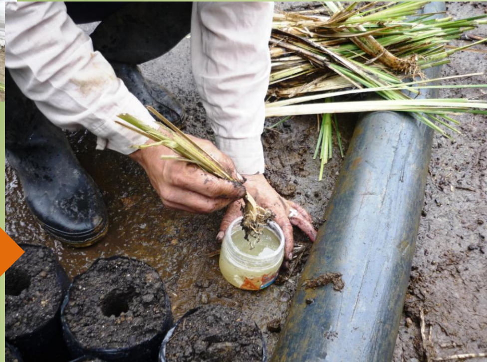
INMERSION DE LOS ESQUEJES EN ENRAIZADOR