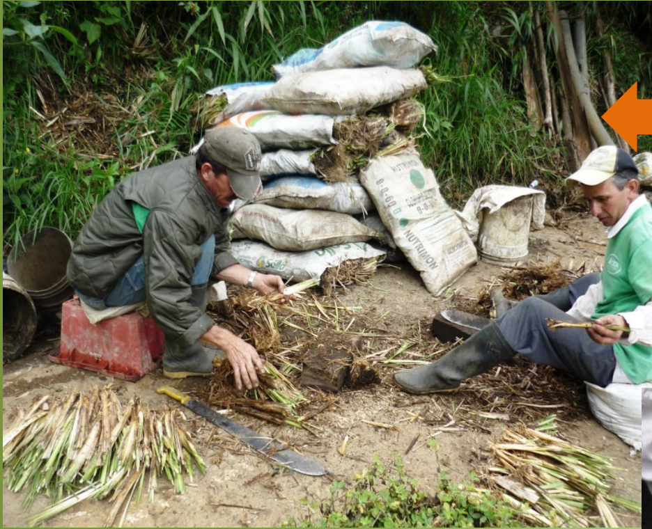
← DESHIJE DE MACOLLAS