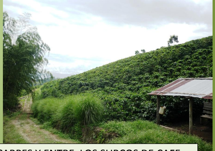
CAFETALES CON VETIVER EN LOS ESCARPES Y ENTRE LOS SURCOS DE CAFE