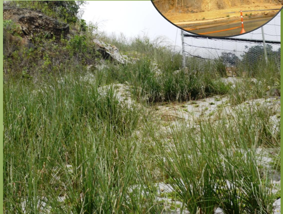
Suelos limo arenosos y limo arcillosos