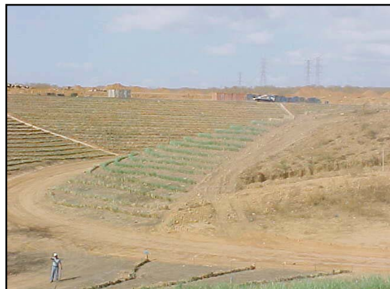
Establecimiento de barreras vivas de vetiver en áreas de talud