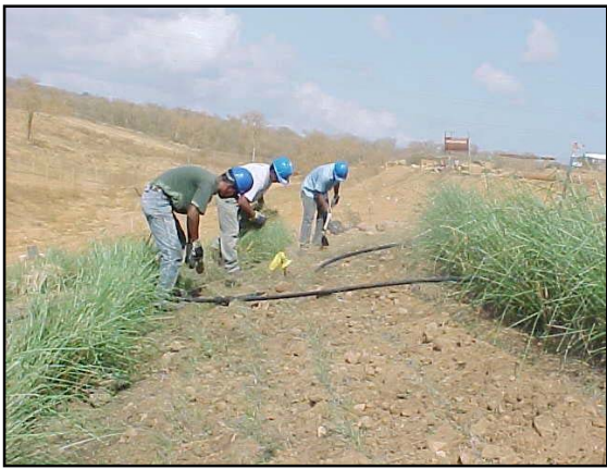
Ajuste del sistema de riego entre las especies vegetales (barreras vivas de vetiver y pasto bermuda)