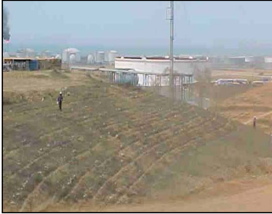
Materia orgánica en superficie y áreas de talud surcadas a curvas de nivel.