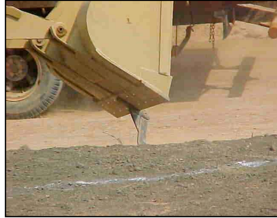
Equipo mecánico mediante el cual se realizó la apertura de los surcos a curvas de nivel en áreas de talud.