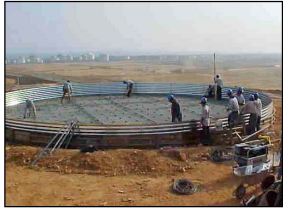
Etapa constructiva del tanque de almacenamiento para el agua de riego de las especies vegetales