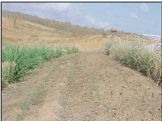
Coberturas vegetales: barreras vivas de vetiver y pasto bermuda